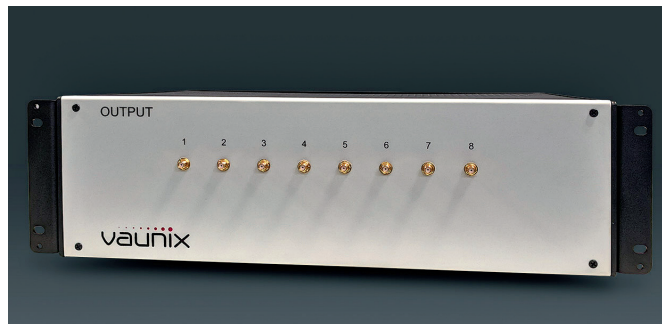
Рис. 3. Матричный аттенюатор VMA-Q8X8SE

на разных этапах их создания. Они могут использоваться как компаниями-разработчиками, так и операторами мобильной связи.