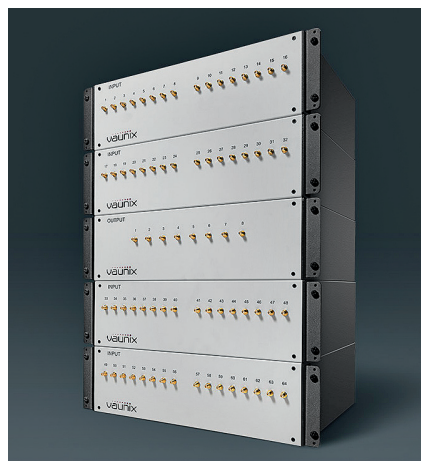
Рис. 2. Матричный аттенюатор VMA-Q64X8SE

VMA-Q64X8SE с количеством входов и выходов 64×8 (рис. 2), несколько позже – модель VMA-Q8X8SE с более скромными возможностями, с числом входов и выходов 8×8 (рис. 3). Данные изделия представляют собой высокоэффективные инструменты, которые прежде всего предназначены для тестирования многоканальных беспроводных систем